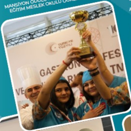
MEB GASTRONOMİ FESTİVALİ VE YEMEK YARIŞMASI MANSİYON ÖDÜLÜ KONYA KARATAY ÖZEL EĞİTİM MESLEK OKULU ÖĞRENCİLERİ