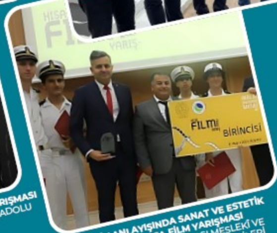
AHİLİK ANLAYIŞINDA SANAT VE ESTETİK KONUSU KISA FİLM YARIŞMASI 1.SI MERSİN TİCARET ODASI MESLEKİ VE TEKNİK ANADOLU LİSESİ ÖĞRENCİLERİ